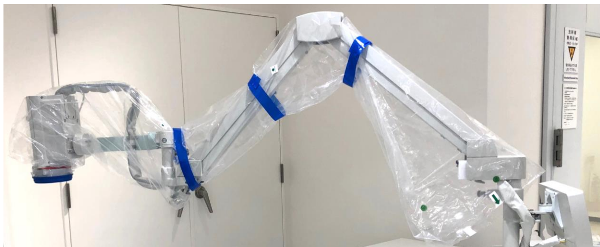
アーム用カバー 装着後全体像

清潔状態を保ちながら、近赤外光の不要な散乱を防ぎ、歪みや曇りのない画像を提供します。